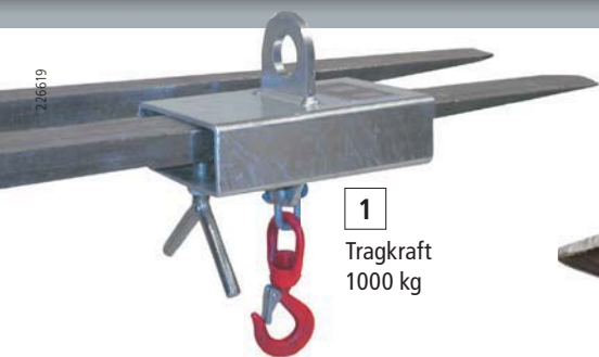
1 Tragkraft 1000 kg